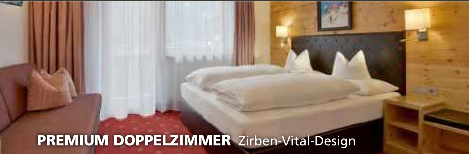
PREMIUM DOPPELZIMMER Zirben-Vital-Design

... alle Zimmer im Hotel mit Balkon im Zirben- und Fichtenholzdesign